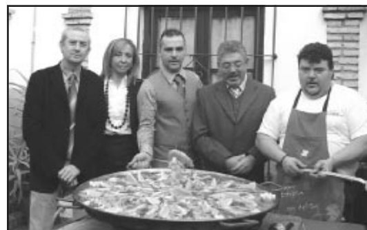
La reina de la fiesta