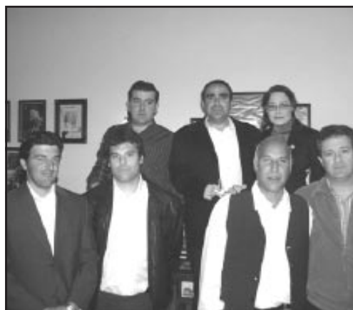
Grupo de músicos y cantaores.