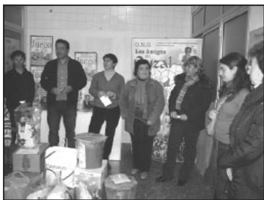
Directores y representantes de los colegios.