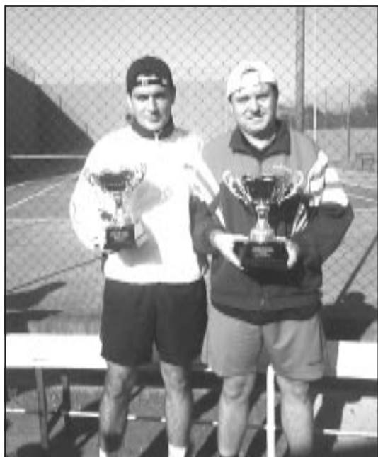
El subcampeón (izda.) y el campeón (dcha.)